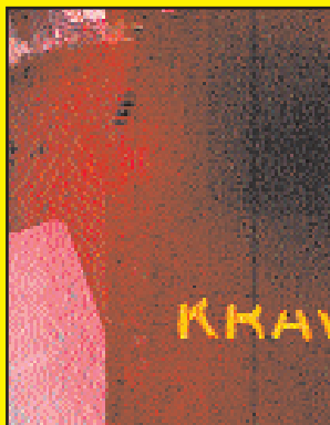
Why Not Associates