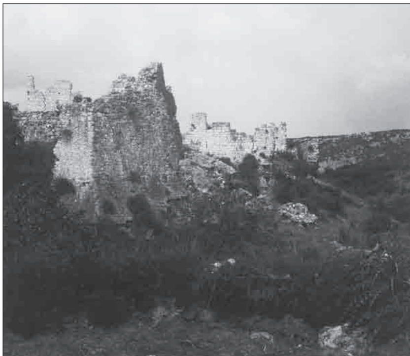
Templáři byli pověřováni péčí o hrady v ohrožených oblastech křesťanství, kde vládce nemohl důvěřovat světským pánům; stavěli však i vlastní pevnosti, aby ochránili majetek řádu. Na obrázku je pohled na jihovýchodní věž a příkop pevnosti Vrana v dnešním Chorvatsku (Lejla Dobronic).

zaplatili response ze svých provincií. Na těchto obecných shromážděních obvykle docházelo i ke jmenování nových hodnostářů a vydávání nařízení. Přestože byly majetky řádu roztroušeny po celém křesťanském světě, udržovaly jednotlivé domy kontakt prostřednictvím pravidelně pořádaných kapitul, dalším zdrojem informací byly oběžníky, posílané bratry v Orientu svým řádovým druhům na Západě.