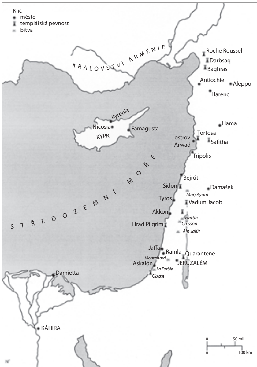
Mapa pobřežního území zaznamenávající úspěchy období první křížové výpravy, jsou zde vyznačena i nejvýznamnější města, výběrově jsou zakreslena i hlavní sídla templářů a místa nejdůležitějších bitev, zmíněných v této knize.

nad městem. Jeden z pramenů uvádí, že skupinka těchto válečníků se rozhodla začít se zbožným životem v kostele sv. Hrobu postaveném na údajném místě Kristova prázdného hrobu, nejuctívanejším svatyně křesťanské víry. Svoje původní