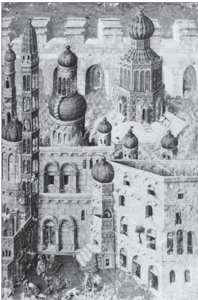
Kostel sv. Hrobu v Jeruzalémě postavený císařem Konstantinem I. (zemřel 337) nad předpokládaným prázdným Kristovým hrobem je ústřední křesťanskou svatyní. Obrázek znázorňuje stav z 15. století, v pozadí je Skalní dóm. Umělec přehnal výšku budov ve vztahu k jejich šířce, obecně je však provedení věrné. Skalní dóm byl postaven kalífou Abd al-Málikem mezi lety 688 a 691 a byl pravděpodobně záměrně připodobněn kostelu sv. Hrobu. Zatímco hlavní část kostela je kruhová, Skalní dóm je oktagonální (rkp. Egerton 1070, fol. 5).

poslání však změnilo pod dojmem útoků muslimských lupičů na poutníky putující do Jeruzaléma, kdy seznali, že Jeruzalémské království rozhodně více potřebuje bojovníky než muže modlitby. Výsledkem bylo na jedné straně vytvoření rytířského řádu a na straně druhé vyslovení přísahy o obraně křesťanů se zbraní v ruce. Idea vo-