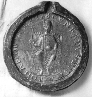
Pečeť Konráda III. Štaufského z roku 1138.

dobylo Brno, s bohatou kořistí se vrátilo zpět do Čech a Vladislav uhradil finanční ztráty z předchozích bojů. Vítězné tažení mu také upevnilo svrchované postavení v českém knížectví. Moravští Přemyslovci se museli českému panovníkovi nejprve v Praze pokořit, teprve pak jim Vladislav II. velkomyslně vrátil jejich úděly pod přísahou, že už nikdy proti němu nepozdvihnou zbraně.