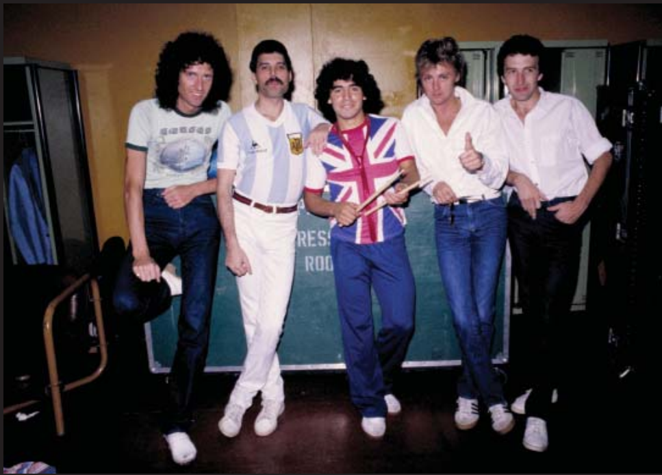
Hore: V zákulisí v Argentíne s futbalovou legendou Diegom „Božskou rukou“ Maradonom, marec 1981.