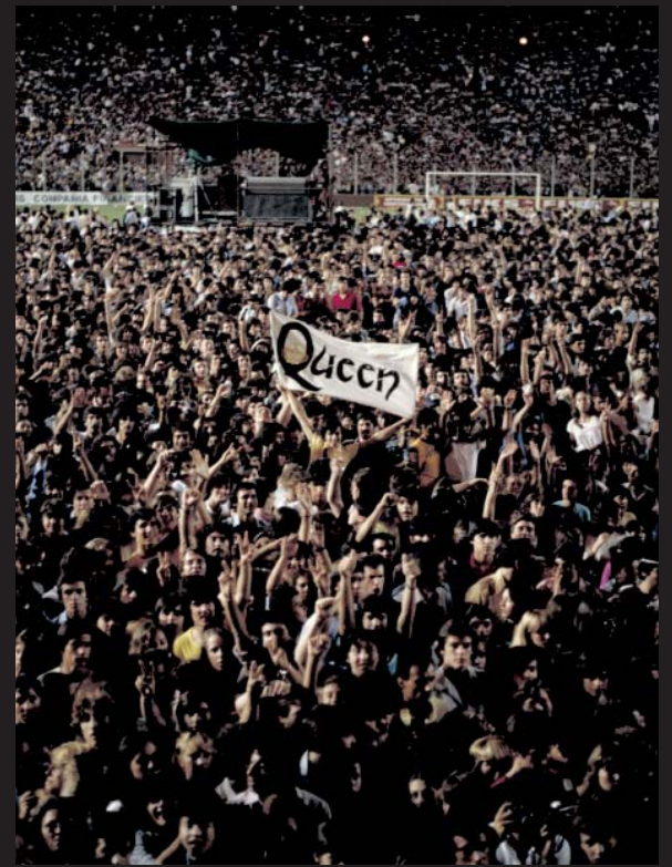
Vpravo: Ďalšie typické publikum Queenu – ak to môžeme takto rozlišovať!