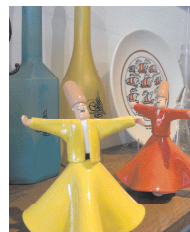
LES ARTS TURCS