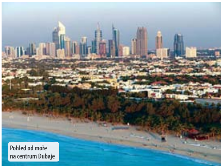
Pohled od moře na centrum Dubaje

Jižně od laguny se rozprostírá druhá důležitá část starého městského centra: Búr Dubai . Tady stojí jedna z nejstarších budov ve městě: pevnost. Byla postavena roku 1787 a po dlouhou dobu sloužila jako sídlo panovníka. Dnes v sobě ukrývá hypermoderní muzeum. K této historické stavbě se připojuje vládní palác (arab. diwān ). Pevnost je vlastně jedinou historickou budovou v Búr Dubai. Další domy, které vypadají staře, byly znovu vybudovány a nabízejí turistům pohled do minulosti, který můžete pocítit ve dvou etnografických oblastech: Bastakia – což je obytná čtvrť s markantními větrnými věžičkami – a Al-Shindagha s různými obytnými domy a jedním rekonstruovaným panovnickým palácem.