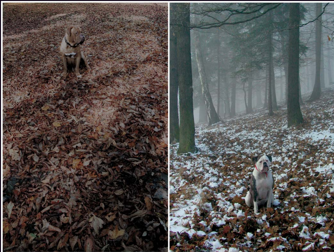
Obrázek 3.8 | Mimikry II Motiv využívající stejné barvy prostředí a modelu. Různí psi a různé prostředí. Vlevo je Růžena ve spadaném kaštanovém listí, vpravo Cecilka v pustém zimním lese.