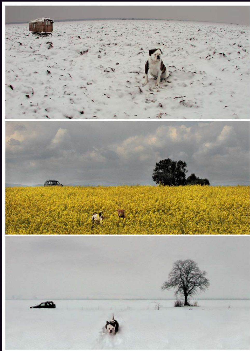
Obrázek 3.9 |

Krajina s maringotkou Fotografie ze seriálu Mimikry pořízená objektivem 17 mm. Digitálním zásahem je vložena pouze maringotka.