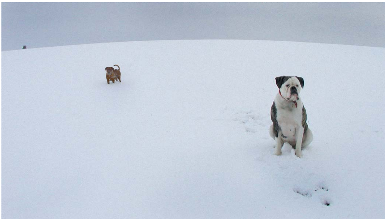
Obrázek 3.5 | V polích Podobně náhodný jako Sestry u koní je i tento záběr zimní krajiny a psů na pustém poli. Jen je použit opačný extrémně širokoúhlý objektiv 17 mm s velkým úhlem záběru. Podařilo se zakomponovat tři výrazné motivy do úhlopříčky, díky čemuž má fotografie řád. Ten poslední tmavý bod v pozadí je posed myslivců.

Fotografovat psa někde v krajině poskytuje větší volnost i možnost využití fotografické techniky. Při použití širokoúhlého objektivu si nemusíme tolik lámat hlavu s hloubkou