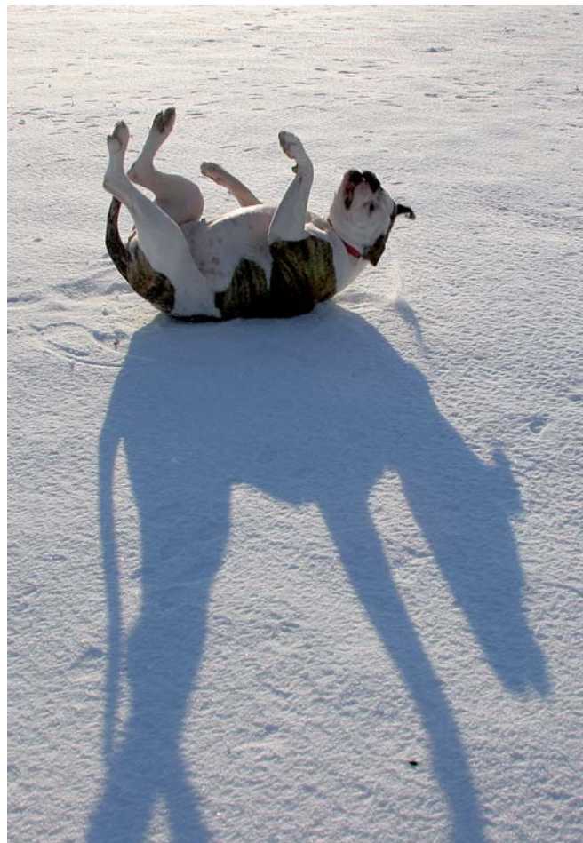
Obrázek 3.4 | Kutululu Využití přímého protisvětla zapadajícího slunce a dlouhých stínů. Ve spojení s válejícím se psem vytváří na bílé ploše sněhu bizarní stíny. Fotografie byla vystavena, spolu s dalšími, i na Czech Press Photo 2007.