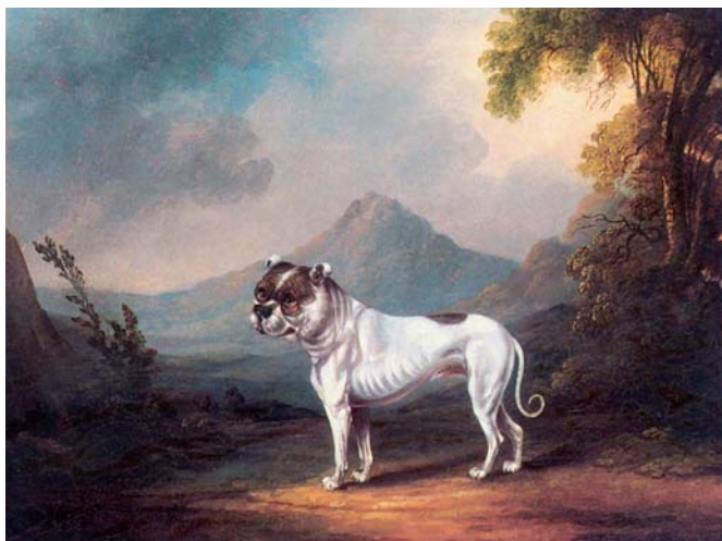
Obrázek 3.1 | Portrait of the Bulldog „Ball“ in a landscape – Henry Cloves (1799–1871), klasická olejomalba z devatenáctého století. Podobných obrazů nejrůznějších psů existují tisíce a můžeme se s nimi setkat i v obrazárnách na našich zámcích. Velká sbírka nejrůznějších psích obrazů je například na zámku Krásný Dvůr u Podbořan.

Pes neodmyslitelně patří ven, do krajiny, i ve fotografii. Je to pro něj nejpřirozenější prostředí a také je nejjednodušší jej venku fotografovat.