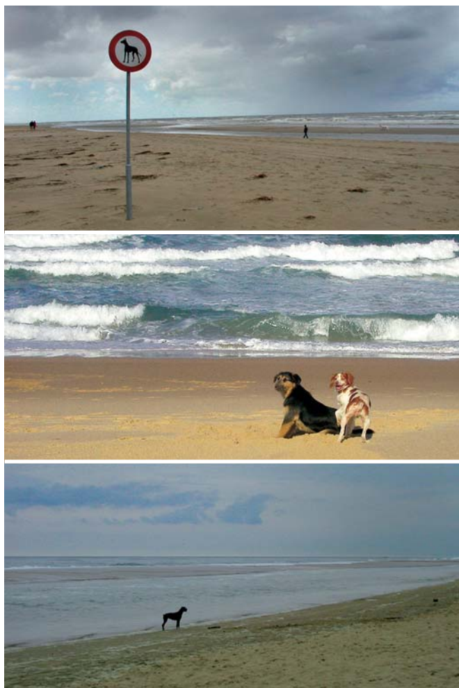
Obrázek 3.3 | Na pobřeží Mořské pobřeží je pro mne stále oblíbeným motivem. Mám rád studená moře, kde jsou vlny a fouká. A většinou tam běhá spousta psů. A vždy si při západu slunce vzpomenu na pána se psem, snímaným hodně dlouhým objektivem, přímo proti oranžovému slunci. To byl moc hezký záběr z filmu Muž a žena.