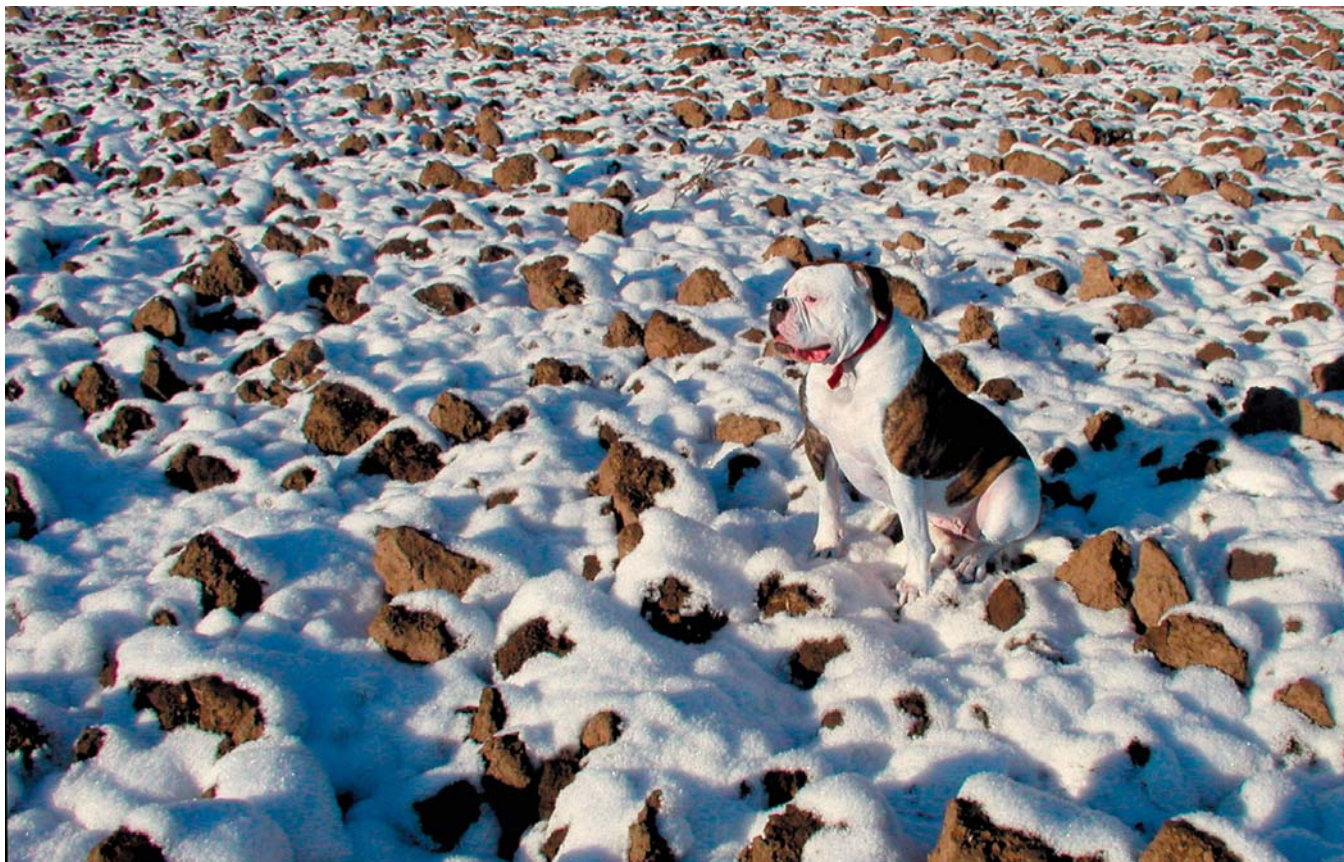
Obrázek 3.6 | Mimikry I. Fotografie, pořízená v podvečer s nízkým, zapadajícím sluncem, je zajímavá stejnou barevností pole a Cecilky. Objektiv 24 mm je zacloněn na clonu 16, aby byla využita co největší hloubka ostrosti. Jinak by to byl naprosto nezajímavý snímek psa, který sedí někde na poli.

ostrosti. Pokud použijeme větší clonové číslo, bude záběr ostrý od popředí až po nekonečno. I perspektiva obrazu je naprosto jiná než při užití objektivu s delším ohniskem. Při použití dlouhého ohniska je zásadní problém naopak s velmi malou hloubkou ostrosti – čím delší ohnisko, tím menší zaostřená část záběru. To má ale často právě výhodu v rozostření nežádoucího pozadí.