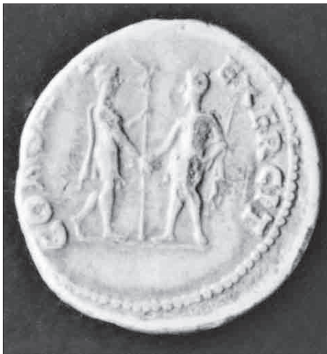
Aureus ražený Vespasianem roku 70 n. l. zobrazuje signiferi různých jednotek potřásající si rukou v období dozvuků občanských válek vedených mezi léty 68 a 70 n. l. Opis mince zní „armáda ve shodě“.