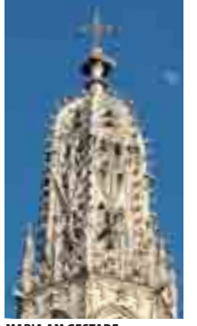
MARIA AM GESTADE