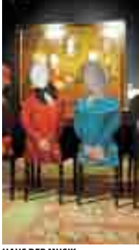
HAUS DER MUSIK