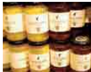
MEINL AM GRABEN