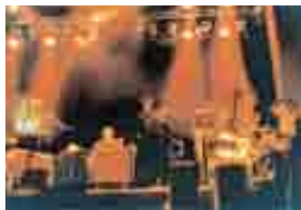
PORGY & BESS