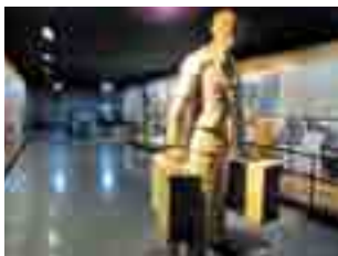
MUSEU D'HISTÒRIA DE CATALUNYA