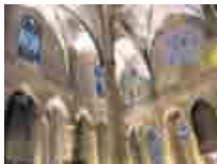
SANTA MARIA DEL MAR