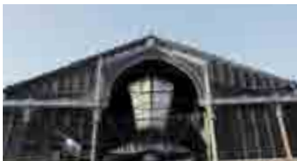
MERCAT DEL BORN