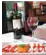
LES QUINZE NITS