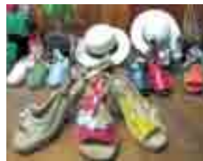
LA MANUAL ALPARGATERA