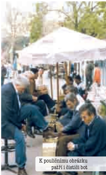
K pouličnímu obrázku patří i čistič bot

V jižní části náměstí Üsküdar Meydanı stojí mešita Yeni Valide Camii postavená roku 1710. Nese jméno po valide (sultánova matka) Gülnüş Emetullah (asi nejbizarnější jméno, jež lze vymyslet – „Růžový nektar Boží věčnosti“), která je pohřbena v otevřené oktagonální türbe v jihovýchodní části komplexu (přímo u hlavní ulice). V mešitě, kterou zdobí dva krásné minarety se dvěma ochozy, je zapotřebí zmínit mramorovou mříž galerie a mihrab s tyrkově zelenými kachli z Kütahey .