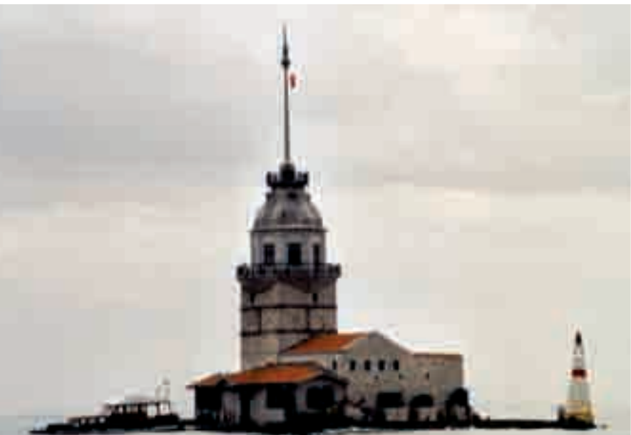
Kız Kulesi, „Dívčí“ nebo „Leandrova věž“

Sestoupíme-li nyní od mešity Ayazma k Bosporu na oblíbenou, živou pobřežní promenádu, můžeme se z přístaviště Salacak malou lodí dostat ke slavné věži Kız Kulesi. „ Dívčí věž “ stojí na malém skalním ostrůvku a v průvodcích bývá často označována jako „ Leandrova věž “. Všeobecně známá pověst vypráví antické milostné drama Leandra a jeho milenky Héró , Afroditiny kněžky, jež ve své věži každé noci rozsvěcela lampu, aby k ní Leandros mohl připlavat. Ale co čert – nebo spíš zlá čarodějnice – nechtěla, jedné noci světlo zhaslo a Leandros uto-