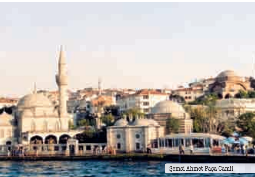
Şemsi Ahmet Paşa Camii

nul, načež se Héró vrhla ze své věže. Tato událost se však prý neodehrála na Bosporu, ale o něco více na jih v Dardanelské úžině, mezi starověkými městy Sestos a Abydos. Důvěřujme tedy turecké variantě pověsti o dívčí věži : Jeden král měl jedinou dceru, kterou měl podle věštcovy předpovědi uštknout had. Vyděšený otec ji nechal převézt na jeden ostrov a pečlivě střežit, aby osud přelstil. Ale proti věštbě nepomohla ani „ Dívčí věž “. Mladý ctitel princezně poslal veliký koš s ovocem, v němž se bez jeho vědomí zahrnul jedovatý had – a drama se odehrálo podle scénáře... (ostatně i na jiných místech v Turecku, protože tu existuje více památek s názvem Kız Kulesi).