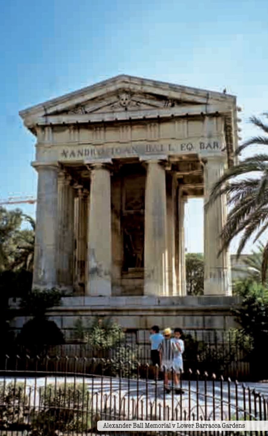
Alexander Ball Memorial v Lower Barracca Gardens