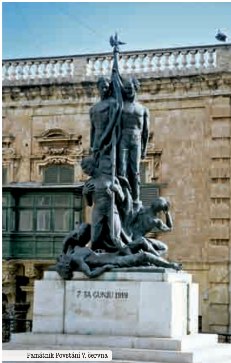
Památník Povstání 7. června

se vyskytuje nezřídka), jako jediná tedy zbývá zbrojnice v přízemí. Sama o sobě se zdá spíše nudná a může být jen malou náhradou za návštěvu paláce. Ty nejpozoruhodnější místnosti jsou nahoře, proto