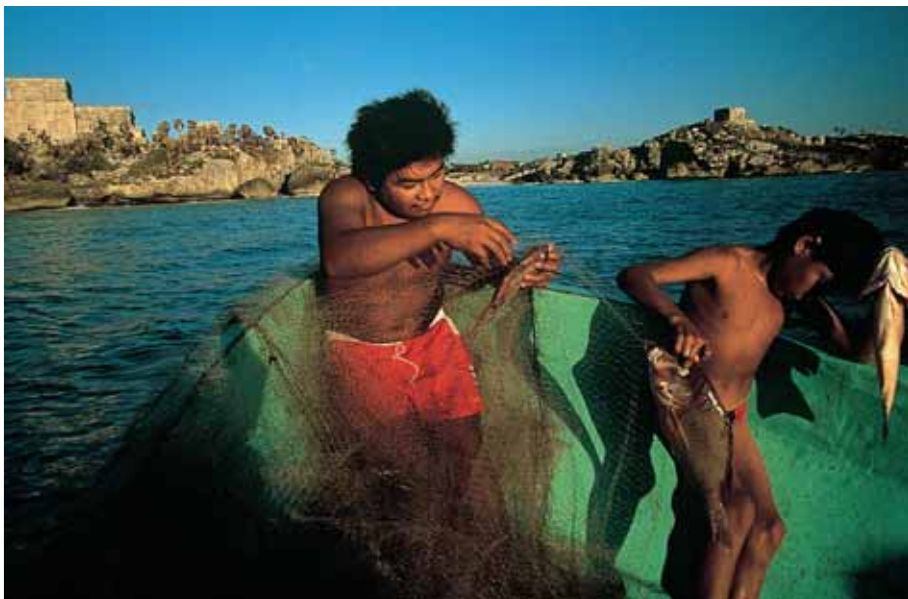
Chlapci se vrací s ranním úlovkem do Tulumu na pobřeží poloostrova Yucatán.

rilové hnutí Zapatistické armády národního osvobození (Ejército Zapatista de Liberación Nacional) a převzalo kontrolu nad několika strategickými městy v hornatém Chiapasu. Jeho příslušníci se sice brzy stáhli zpět do lesů, ale díky článkům na Internetu a různým prohlášením pro sdělovací prostředky se jim podařilo upozornit svět na neutěšenou situaci venkovské populace.