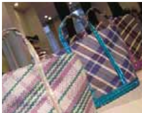
LE BON MARCHÉ/LA GRANDE ÉPICERIE

a-Tour d'Argent. Šéfkuchař ovládá umění nože. Rezervace předem. Z jídelního lístu 50 €.