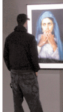
WAR PHOTO LIMITED