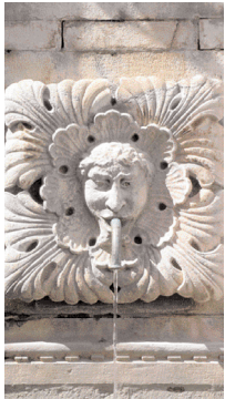
VELIKA ONOFRIJEVA FONTANA