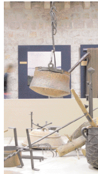
ETNOGRAFSKI MUZEJ RUPE