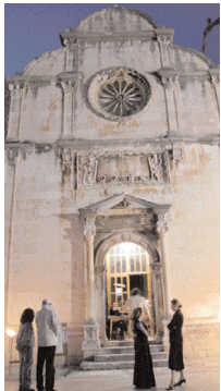
CRKVA SV. SPASA