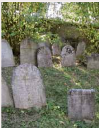
▲ ▼ Židovský hřbitov v Kasejovicích

Otvírací doba: ☉ cenová hladina: ★ 335 44 Kasejovice www.kasejovice.cz www.zidovskemuzeum.cz