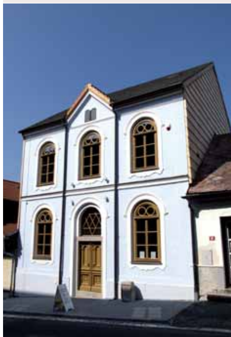
▲ Hartmanická synagoga