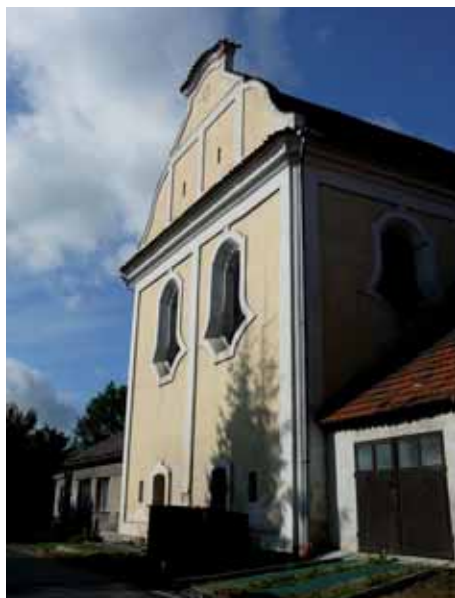
◀ Kasejovická synagoga