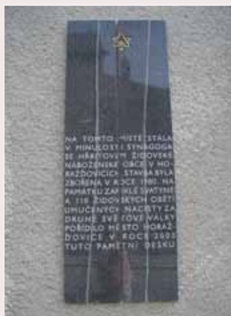
◀ Židovský hřbitov v Kolinci