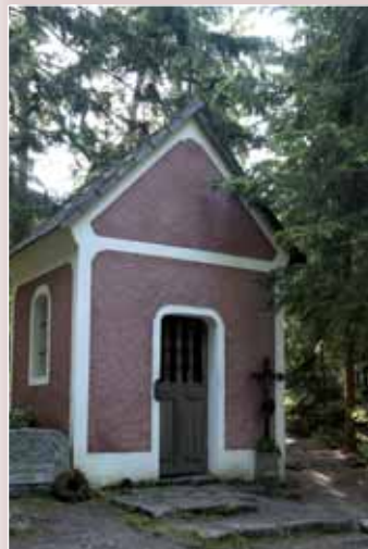
▲ Vintířova kaplička

◀ Poutní kostel sv. Vintíře v Dobré vodě u Hartmanic