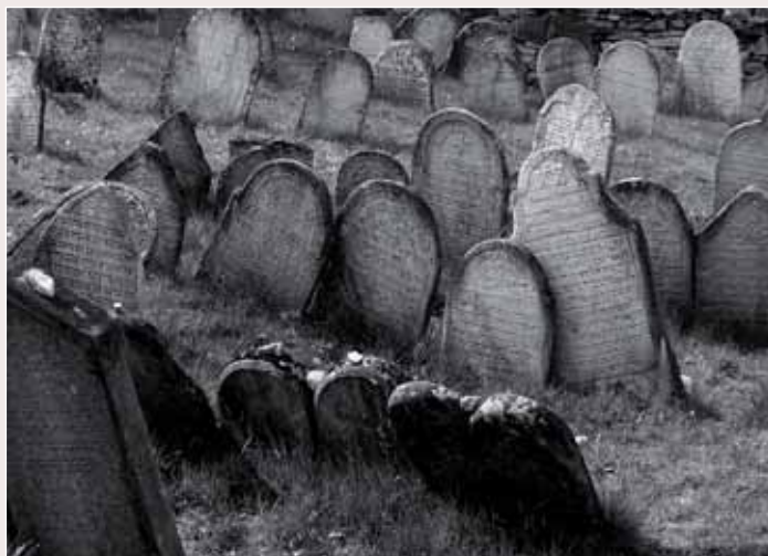
Židovský hřbitov v Rabí ▲