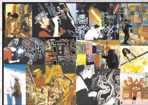
VIZUALNI SYSTÉM: UNDERGROUND URBAN STREET ART