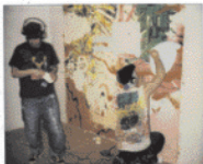
STENCH LIVE! @ UK VS JAPAN PARCO 03