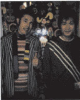
KIMIOYOSHI FUTORI KAM TANG UK VS JAPAN