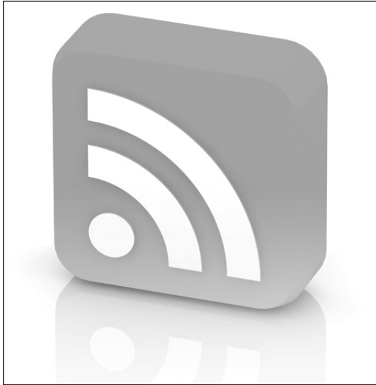
Obrázek 120: Obrázek označující RSS

Uživatelé Internetu mohou RSS z jiných stránek sledovat těmito způsoby: