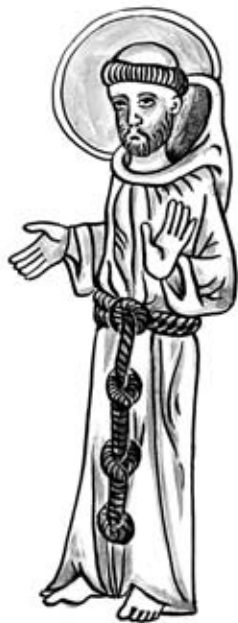
Benediktinský mnich dle iluminace ze 13. století