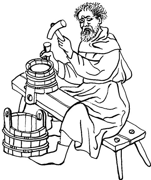
Bednář dle iluminace ze 14. století