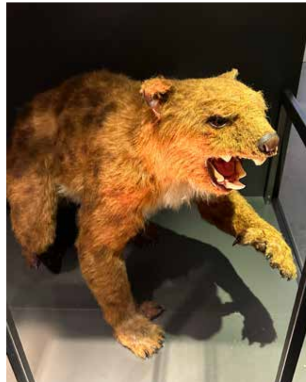
Největší masožravý vačnatec, který kdy žil. Měl tak silný stisk čelistí, že dokázal drtit kosti podobně jako dnešní hyeny.