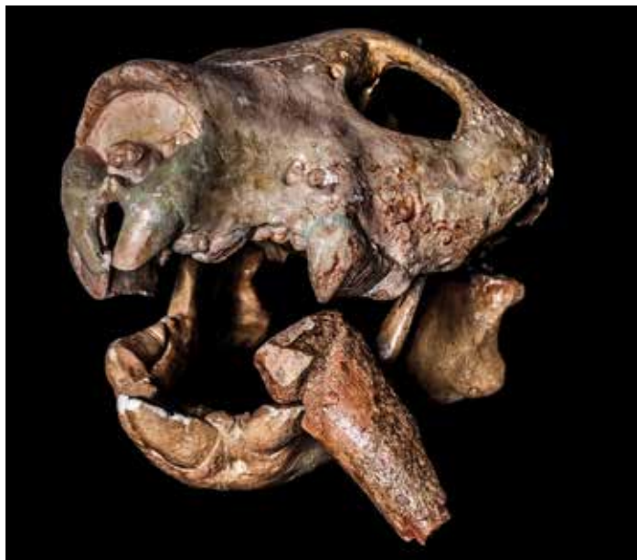
Nártní kost pravěkého klokana v čelistech vačnatého lva (Thylacoleo carnifex)