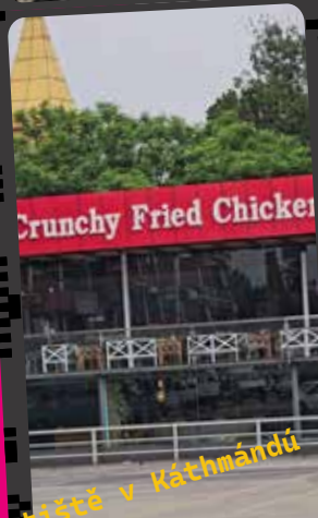
Letiště v Káthmándú