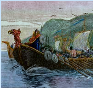
Vikingovia patrili medzi najzručnejších staviteľov lodí, námorníkov a navigátorov v západnom svete raného stredoveku.

Táto nejednotná opozícia pomohla Vikingom dobyť severné a stredné Anglicko, kde založili kráľovstvo, ktoré trvalo takmer 100 rokov, a okupovať územie v severnom Francúzsku, kde sa z ich potomkov stali po francúzsky hovoriaci Normani. Na východe Vikingovia obchodovali a podnikali nájazdy pozdĺž ruských riek, čo im prinieslo striebro z islamského sveta a kontakt s Byzantskou ríšou.