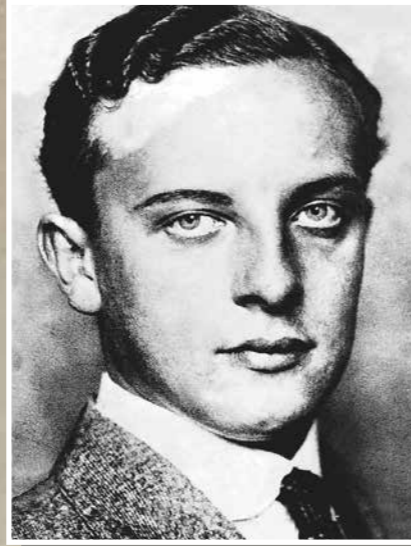
Sidney Fox, který v říjnu 1929 zavraždil v hotelu v Margate svou matku.

Jenže Fox obnovil 22. října na jediný den matčinu životní pojistku. Pojišťovna měla pochybnosti