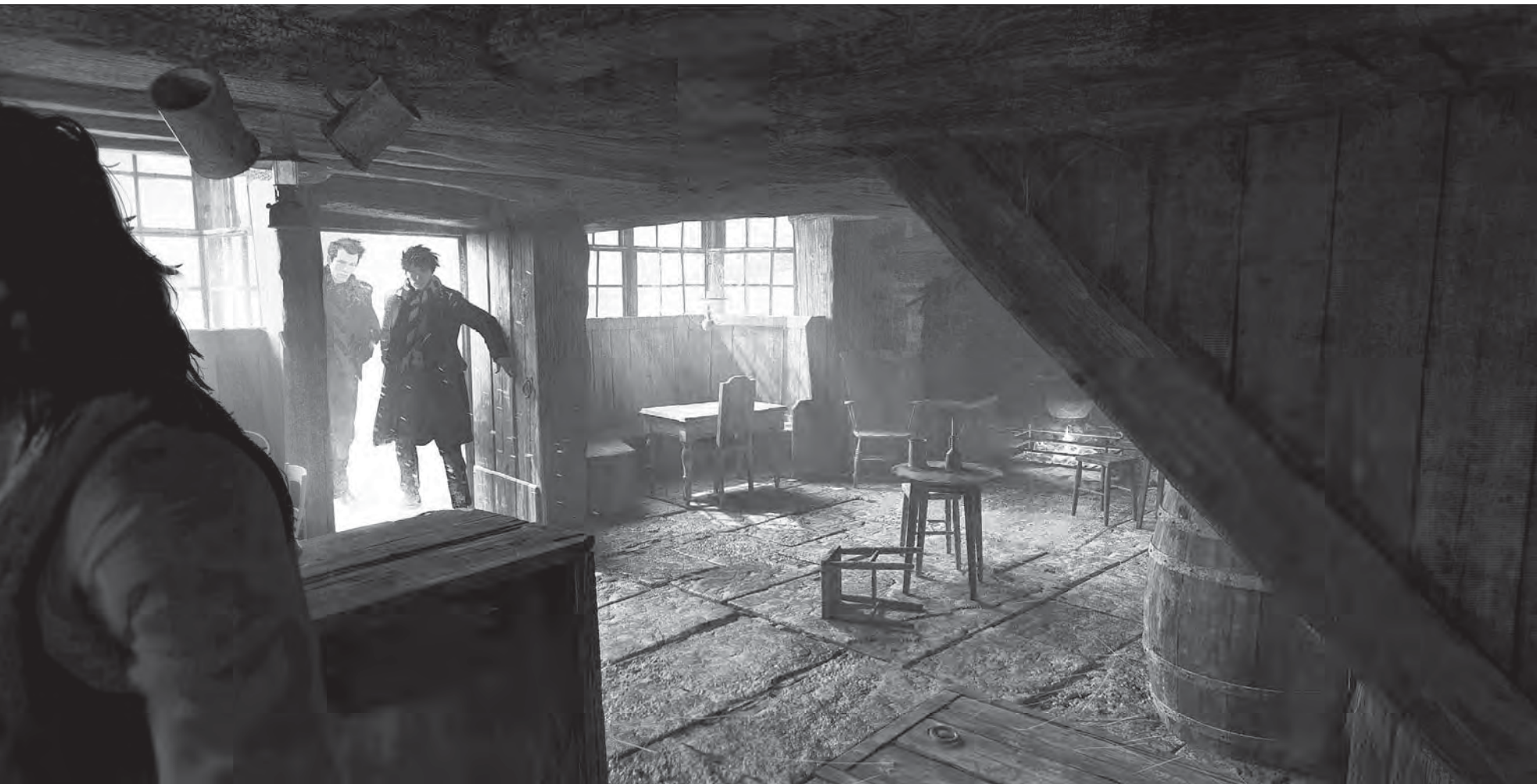
U PRASEČÍ HLAVY - RENDER LOKACE