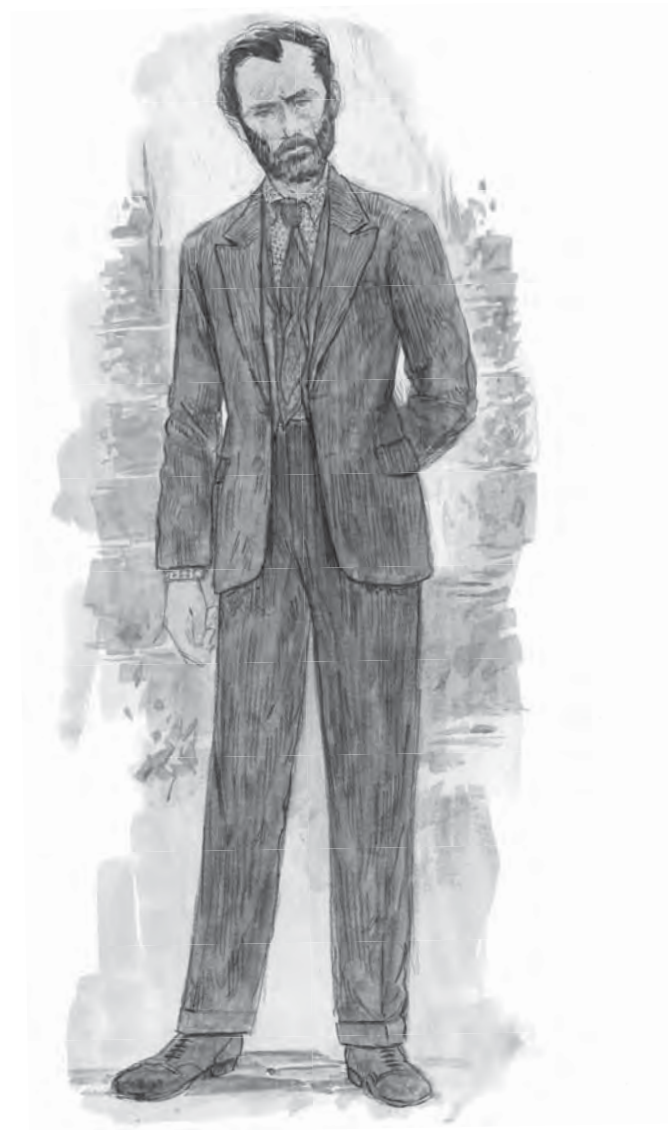
SKICA KOSTÝMU ALBUSE BRUMBÁLA