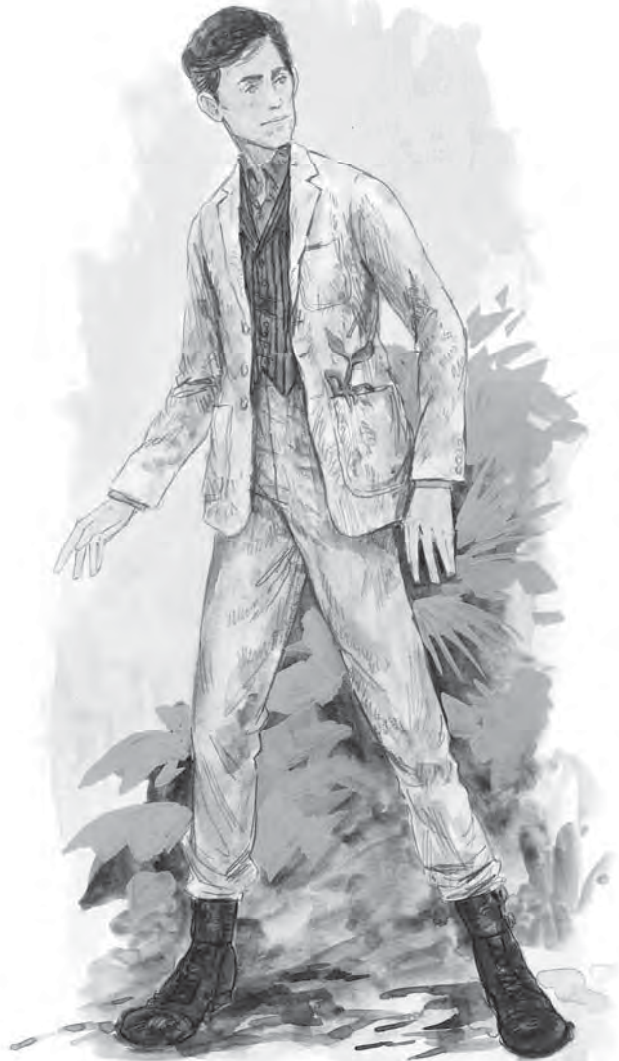
SKICI KOSTÝMŮ MLOKA SCAMANDERA