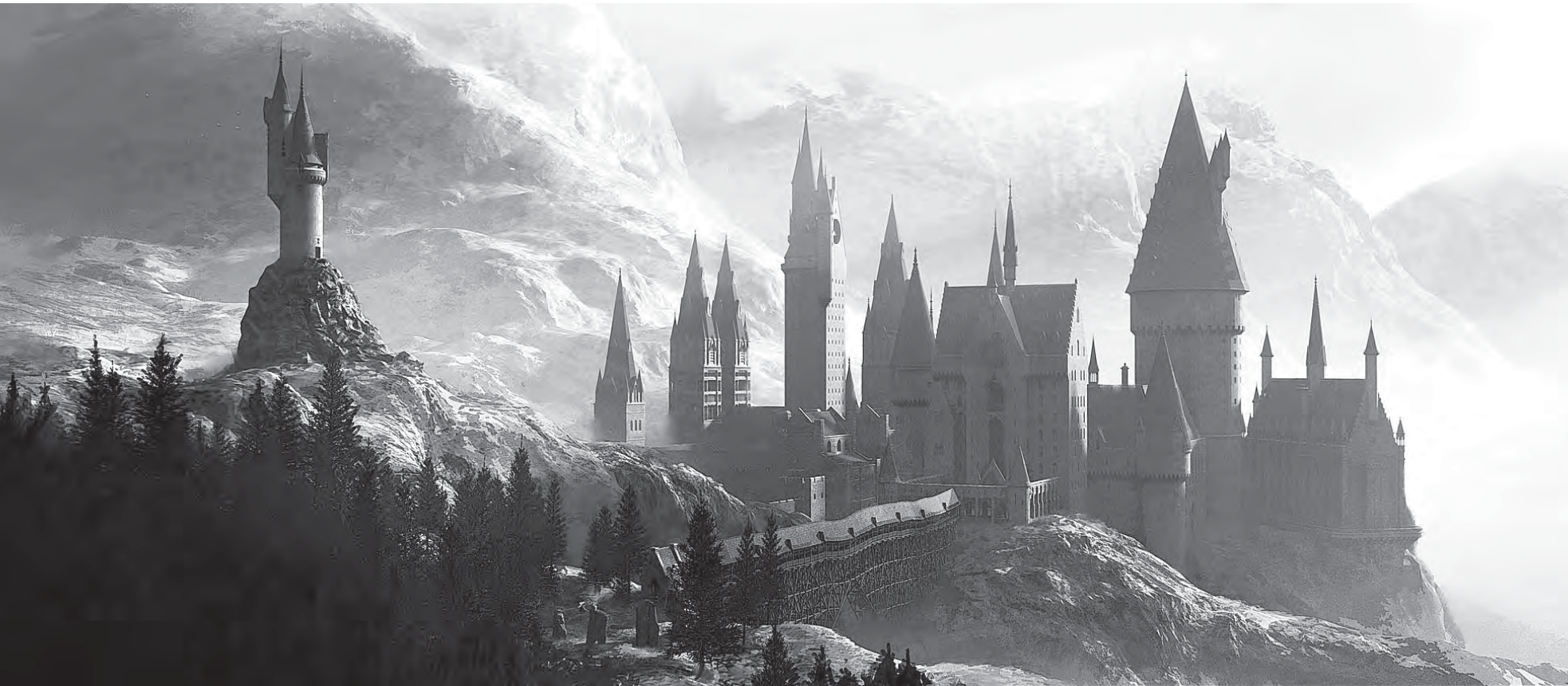
EXTERIÉR BRADAVIC – RENDER LOKACE