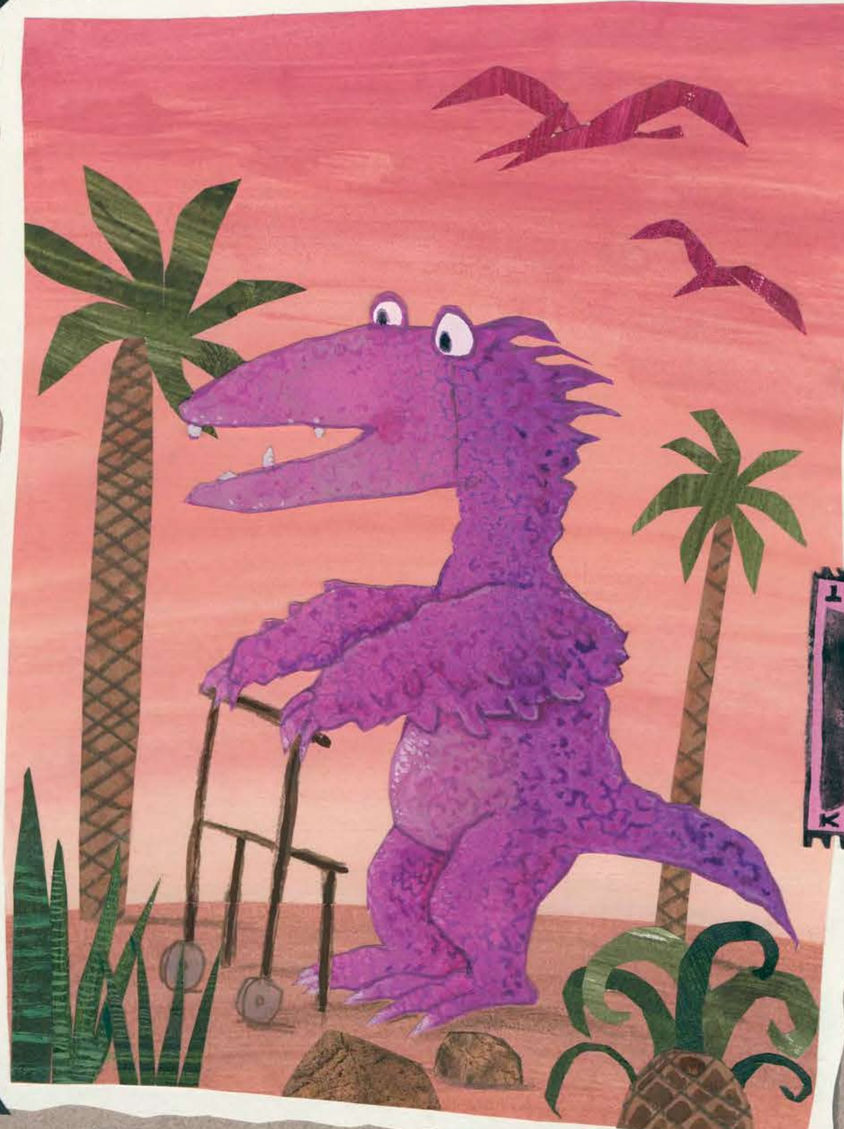
Děda s vlastnoručně vyrobeným chodítkem

Tramtaradá! Naše rodinné album, dědí se po generace. Dostala jsem ho od dědečka (a ten ho měl od svého dědy). To obrovské vejce za mnou jsem také zdědila. Podívejte, tady jsou velociraptoři, moji pra-pra-pra-pra-pra-pra-pra-pra-pra-předci. Poznáváte ty pařáty?