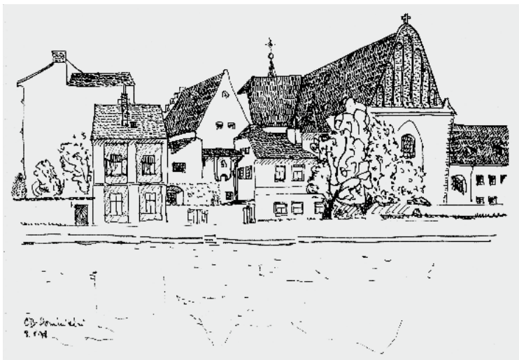
České Budějovice, u staré Malše