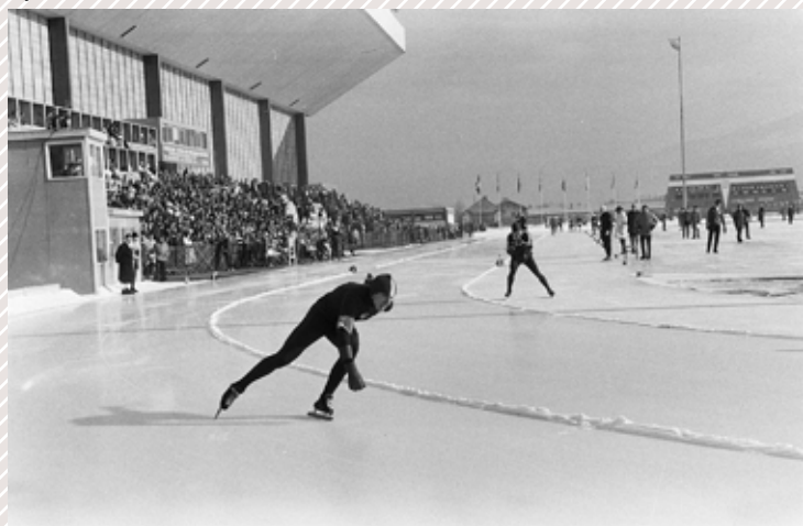
Rychlobruslení v Innsbrucku