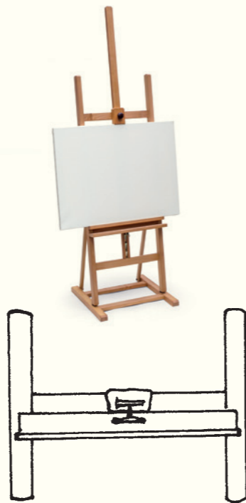
Malířský stojan: 90 × 70 × 220 cm

„Výborně! Jestli ale použiješ měřítko 1 : 10, pokoj s nábytkem se ti nevejde na papír formátu A4. Zkus měřítko 1 : 20. A takto to udělej se všemi kousky nábytku. Pak si je vystříhej.“