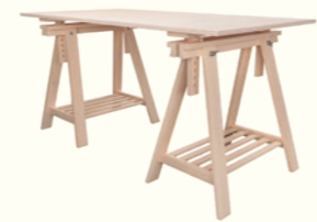
Psačí stůl: 180 × 70 × 76 cm

Skříňka: 40 × 100 cm, v měřítku 1 : 20 je to 2 × 5 cm