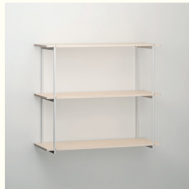
Table skříň je fajn, protože není moc vysoká. A hlavně je bílá. Třeba si ji někdy pomaluju.

Paráda! Poličky působí, jako by se vznášely. Vystavím si na ně svoje sošky, modely a knížky.