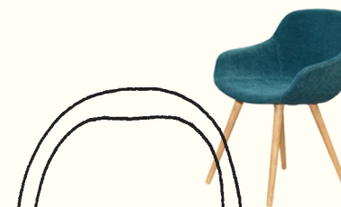
Křesílko: 60 × 60 × 86 cm

Nábytek vypadá v půdorysu jako obyčejné obdélníky. Za chvíli se v tom nevyznám. Musím si je popsat!