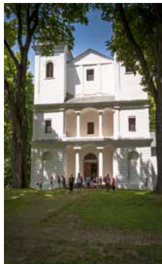
▲ Pôvodne barokový, klasicisticky prestavaný Kostol Zdvhania sv. Kríža na Slanickom ostrove dnes slúži ako originálna galéria

hradba Vysokých Tatier so štítni, ktoré aj v horúcom lete pokrýva trblietavý sneh. Vodná plocha ponúka hromadu možností pre milovníkov kúpania, vodných športov aj obyčajného letného relaxovania. Pobyt si navyše môžete spestriť výletom na Slanický ostrov, kde je každý rok od polovice mája do polovice septembra vo vysvätenom kostole otvorená stála expozícia ľudového umenia zo zbierok Oravskej galérie. Popri túlaní sa v okolitom parku si prezriete lapidárium oravskej rezbárskej a kamenosochárskej tvorby 18. a 19. storočia s typickými ľudovými sakrálnymi výtvormi, zaujímavá je aj výstavka v bývalej hrobke, mapujúca budovanie oravskej priehrady a históriu zaplavených obcí. Okrem toho sa v júni a júli konajú v kostole