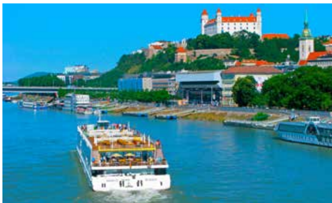
▲ Osobný prístav v Bratislave

❗ Upozornenie: Malé parkovisko je v areáli prístavu, kde je aj kaviareň, reštaurácia, informačné centrum a predajňa suvenírov. Okrem knižných sprievodcov a pohľadníc tu dostanete kúpiť aj najrôznejšie darčeky s námorníckymi motívmi a drevené miniatúry lodí. ■