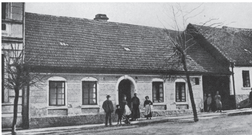
Rašínův rodný dům v Nechanicích, Rašínův památník, Praha 1927