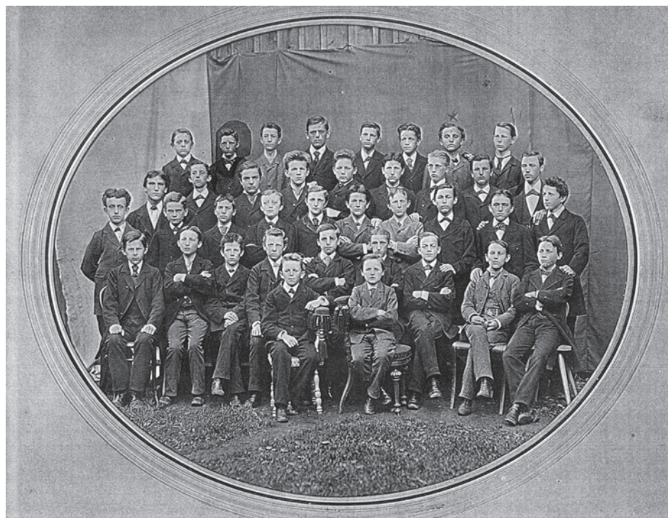
Rašín na broumovském gymnáziu (označený křížkem)

Po roce přestoupil do českého gymnázia v Hradci Králové, hořkých vzpomínek na Broumov se však patrně nikdy nezabavil. 6