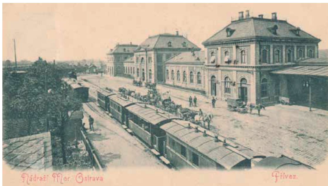
Pohlednice ze Svinova zobrazuje vlakové soupravy místní dráhy do Klimkovic před nádražím KFNB. Na silnici jsou pouze kočáry a žádné automobily, tedy období krátce po zahájení provozu místní dráhy, tedy v letech 1913 nebo 1914.

provoz v Ostravě. Tato společnost velmi rychle elektrizovala trať, vybudovala další zastávky a 16. května 1926 zahájila tramvajový provoz ze Svinova do Klimkovic a trať napojila na systém ostravské městské dopravy. Součástí městské dopravy byla i doprava železničních nákladních vozů tažených tramvajovými elektrickými nákladními vozy. Nákladní doprava do Klimkovic byla provozována až do 31. ledna 1972. V souvislosti s úpravami komunikací před svinovským nádražím (tehdy Ostrava-Poruba) došlo v roce 1977 k definitivnímu zastavení tramvajového provozu a trať byla snesena.