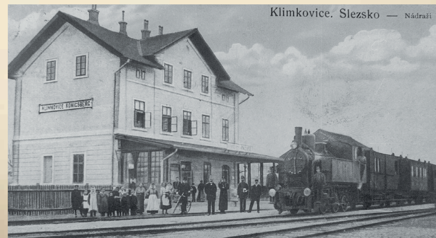
Nádraží v Klimkovicích v období rakousko-uherské monarchie. V čele osobního vlaku jedna ze dvou původních lokomotiv místní dráhy vyrobená v lokomotivce Společnosti státní dráhy v roce 1911.