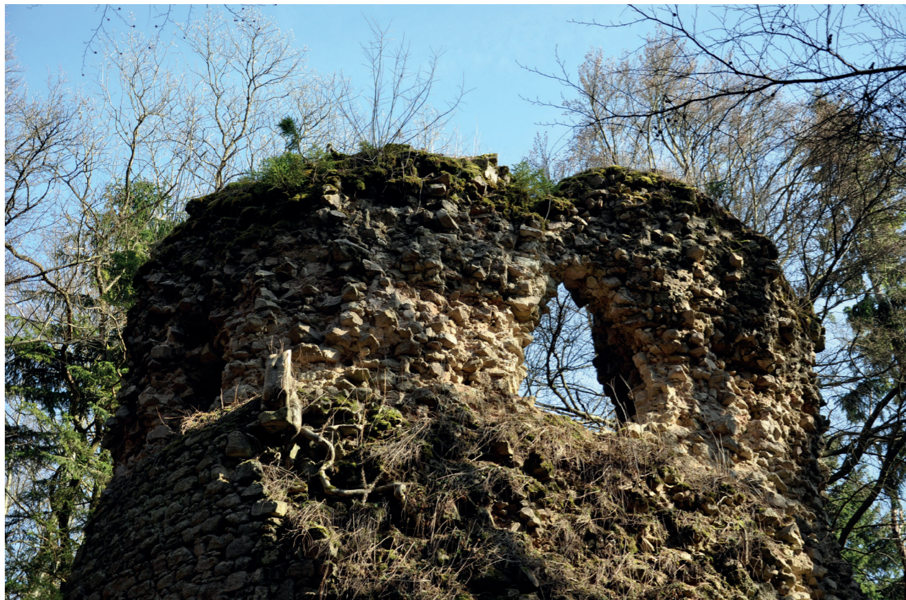
Kynžvart – současný stav

Jak kynžvartský hrad vypadal před zničením oddíly zemské hotovosti v roce 1347, prakticky nevíme. Jeho současné pozůstatky pocházejí především z přestavby Hynčíka Pluha na přelomu 14. a 15. století. Tehdy získal trojdílnou dispozici s dvojitým předhradím s branskou hranolovou věží a s jádrem, chráněným okružním příkopem. Do vnitřního hradu se vcházelo další věžovou branou, otevřenou do nádvoří, kde stál palác dnes již neznámé podoby a nárožní věž netypického nepravidelně oválného půdorysu. Hrad, prakticky znovu vystavěný za vlády krále Václava IV., se