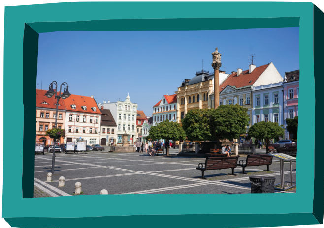
město Česká Lípa

Česká Lípa není jen město v severních Čechách. Lípa je český národní strom a také patří k tradičním symbolům našeho státu, ale zdaleka ne tak dlouho, jak by se mohlo zdát. Posvátný strom Slovanů (stejně jako většiny Evropanů) byl vždy dub. Nejvýznamnější bůh Slovanů se jmenoval Perun (bůh hromu, tedy bouřky, to jistě vzbuzovalo respekt) a strom, který staří Slované prokazatelně uctívali, byl dub. Jenže to se nehodilo našim předkům v době českého národního obrození. Zhruba do konce 18. století bylo totiž obyvatelům našich zemí celkem jedno, jakým jazykem, kdo hovoří. Třenice i kruté války