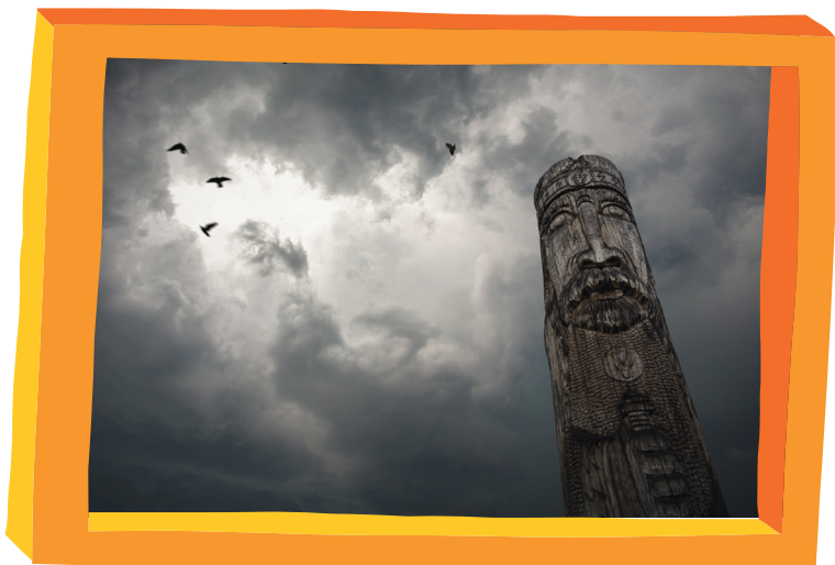
slovanský bůh Perun

Donedávna uznávaný dub si to „schytal“ už v díle našich obrozenských autorů. Např. Ján Kollár ve vydání básnické skladby Slávy dcera z roku 1832 píše: „Jakýs vepřík přivázaný k dubu / z Lipska od lip a škol lipštanských / přišlý, na žaludech germánských / i zde válí se a pase hubu.“ Takže dub dostal postupně od Čechů na frak a v revolučním roce 1848, kdy si Němci na tzv. Frankfurtském sjezdu zvolili oficiálně za národní strom opravdu dub, na Slovanském sjezdu v témže roce byla naopak zvolena lípa.