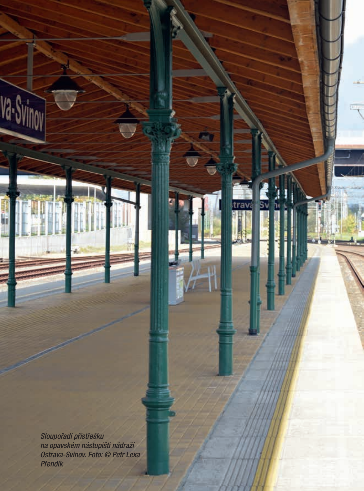
Sloupořadí přístřešku na opavském nástupišti nádraží Ostrava-Svinov.