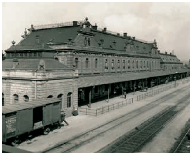
Svinovské nádraží s neobarokní budovou ve 20. letech 20. století.

... svinovské nádraží bylo propojeno železnicí s Opavou roku 1855?