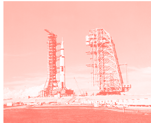
Komplex Saturn-Apollo 11 na pojízdné odpalovací rampě