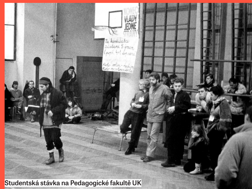
Studentská stávka na Pedagogické fakultě UK