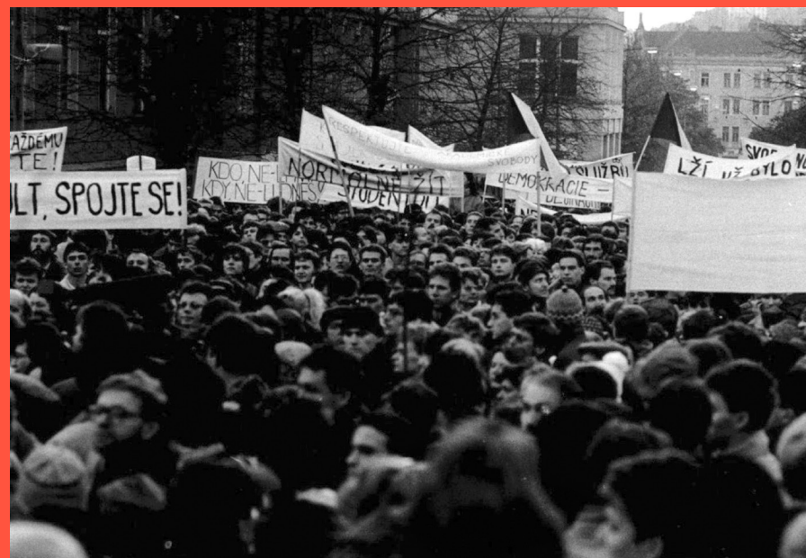
Pražský Albertov, 17. 11. 1989