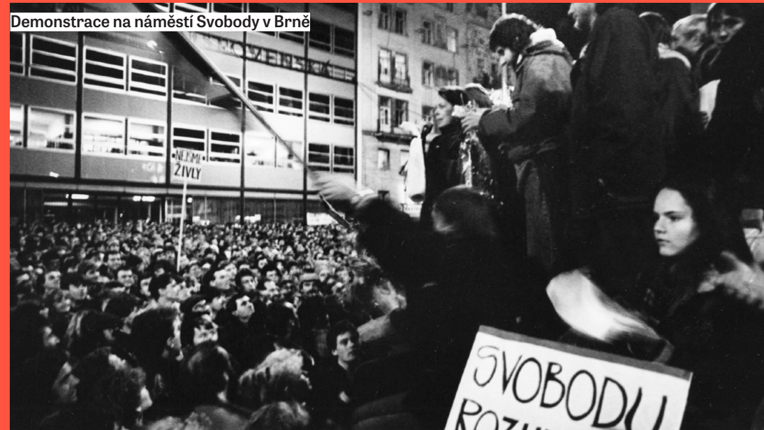
Demonstrace na náměstí Svobody v Brně

Proti režimu se postavili i ti, na které režim nejvíc spoléhal.