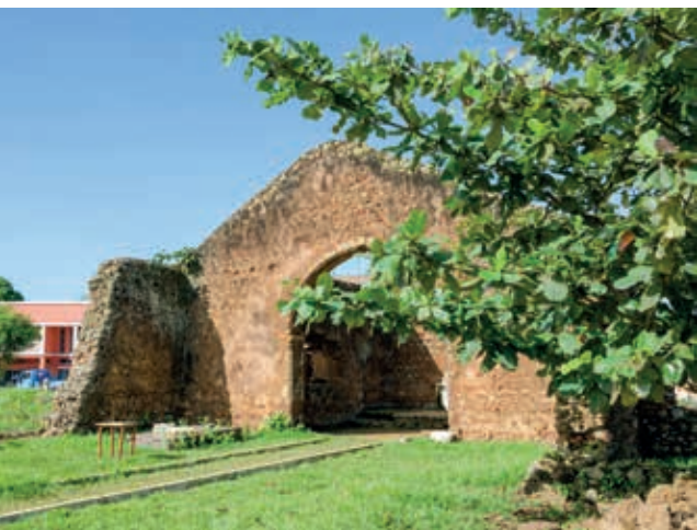
Pozůstatky nejstarší katolické katedrály v subsaharské Africe