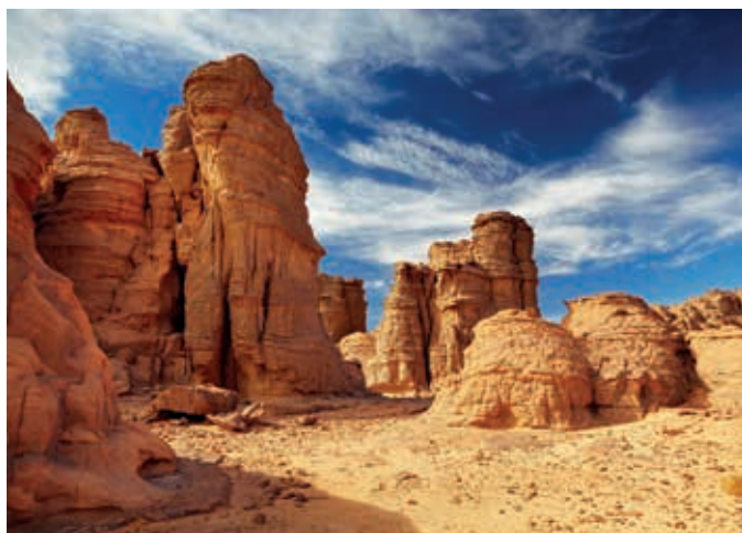
Pískovcové útesy v národním parku Tassili

Pohoří Tassili patří k nejvýznamnějším lokalitám prehistorického skalního umění v severní Africe. Skalní rytiny zde vznikaly od doby před 12 tisíci lety až do prvních století našeho letopočtu. Dokumentují, jak se proměňoval život dávných obyvatel této části Sahary, která původně nebyla pouští, ale savanou s řekami, po které se proháněla stáda zvířete. Kromě těchto historických památek má Tassilský národní park oplývající strmými skalními věžemi a bránami z červenavého pískovce význam i z geologického hlediska.