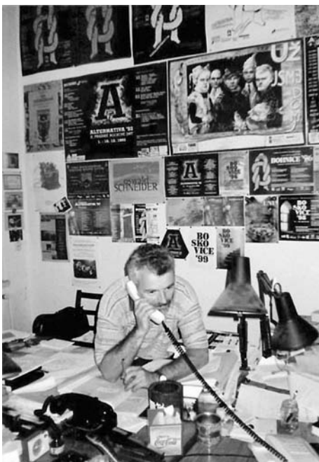
V kanceláři Unijazzu v roce 1999