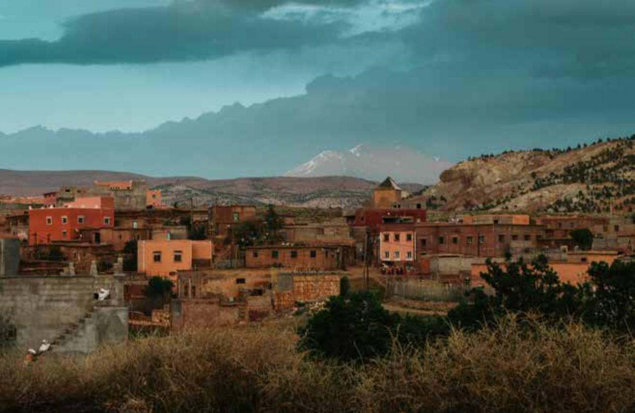
Vesnice Telouet a pohoří Vysoký Atlas v pozadí. Březen 2019, Maroko.

Další suvenýr v podobě odřeného laku si už Dodynka z Marrákeše neodveze.