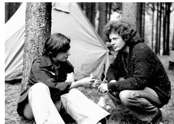
Prázdniny na Zvíkově v roce 1978, parník Jazzove sekce

nejvíc pomohlo... Byly to blbě časy, ale těžko se to vysvětluje, neumím už například do detailů popsat působení různých partajních převodových pák a normalizační každodennost: prostě na té škole začal fungovat nový svaz mládeže, komunisti se snažili dostat studenty pod kontrolu, stejně jako všechny ostatní. Chodil jsem na vysokou dlouho, pořád jsem to natahoval, přerušoval a opakoval, mimo jiné kvůli vojně – tehdy se říkalo, že kdo vydrží v civilu do třiceti, toho už neodvedou. A zajímavé bylo, jak se na té škole měnila atmosféra: parta, s kterou jsem začínal, byla úplně jiná než ta, s kterou jsem končil, v pozdějších ročnících už jsem mezi studenty neměl kamarády, protože s lidmi, kteří nastupovali později, jsem si vlastně neměl o čem povídat. Měli jinou zkušenost, jiný prožitek, v osmašedesátém byli o důležitých několik let mladší, což znamenalo naprosto odlišní.“