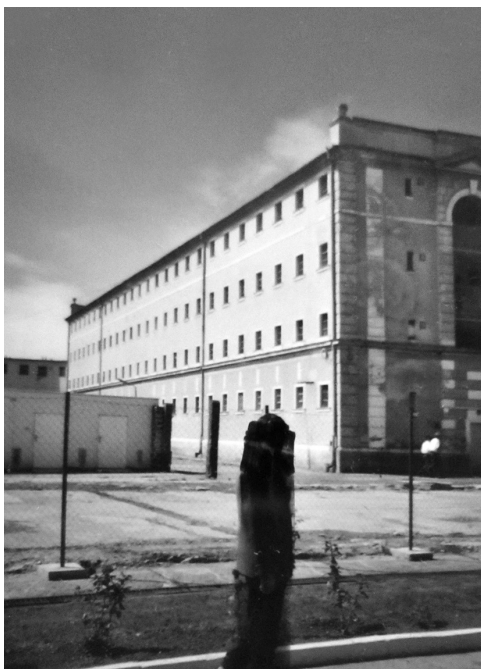
Věznice v Leopoldově