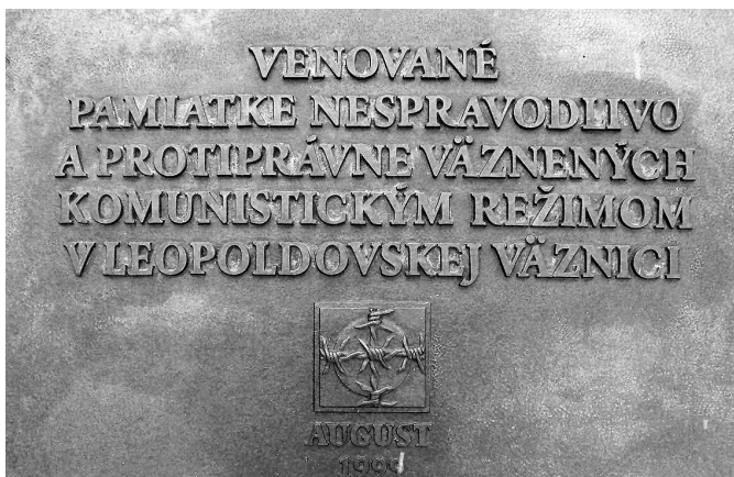
Pamětní deska umístěná na věznici v Leopoldově