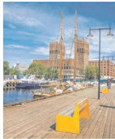
POHLED Z PŘÍSTAVU NA RÅDHUSET