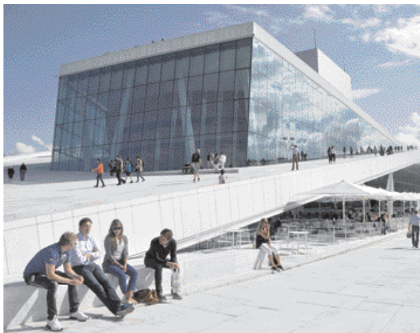
DEN NORSKE OPERA & BALLETT, OPERA V OSLO

Ano: ja ; ne: nei ; dobrý den: hei, goddag ; na shledanou: ha det bra ; dobrou noc: god natt ; prosím vás: vær så snill ; děkuji: takk ; promiňte: unnskyld meg ; nerozumím: jeg forstår ikke ; nádraží: stasjon ; letiště: flyplass ; přístav: havn ; vlevo: venstre ; vpravo: høyre ; snídaně: frokost ; oběd: lunsj ; večeře: middag