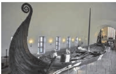
BYGDØY / VIKINGSKIPSHUSET