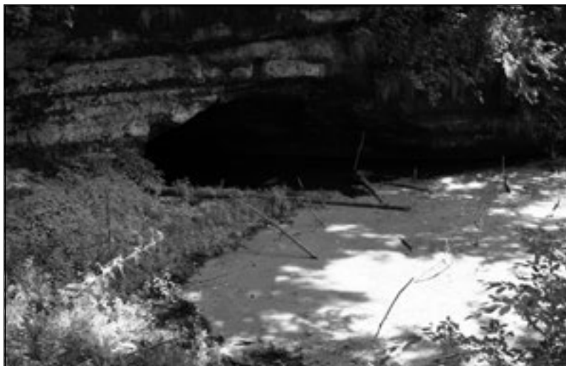
Rozsáhlé historické podzemí pod Lemberkem není dosud zcela prozkoumané.

V osmdesátých letech 20. století se začaly ve zdech leberského zámku objevovat praskliny. Aby zjistil příčinu těchto prasklin, požádal Okresní národní výbor v České Lípě o pomoc psychotronika