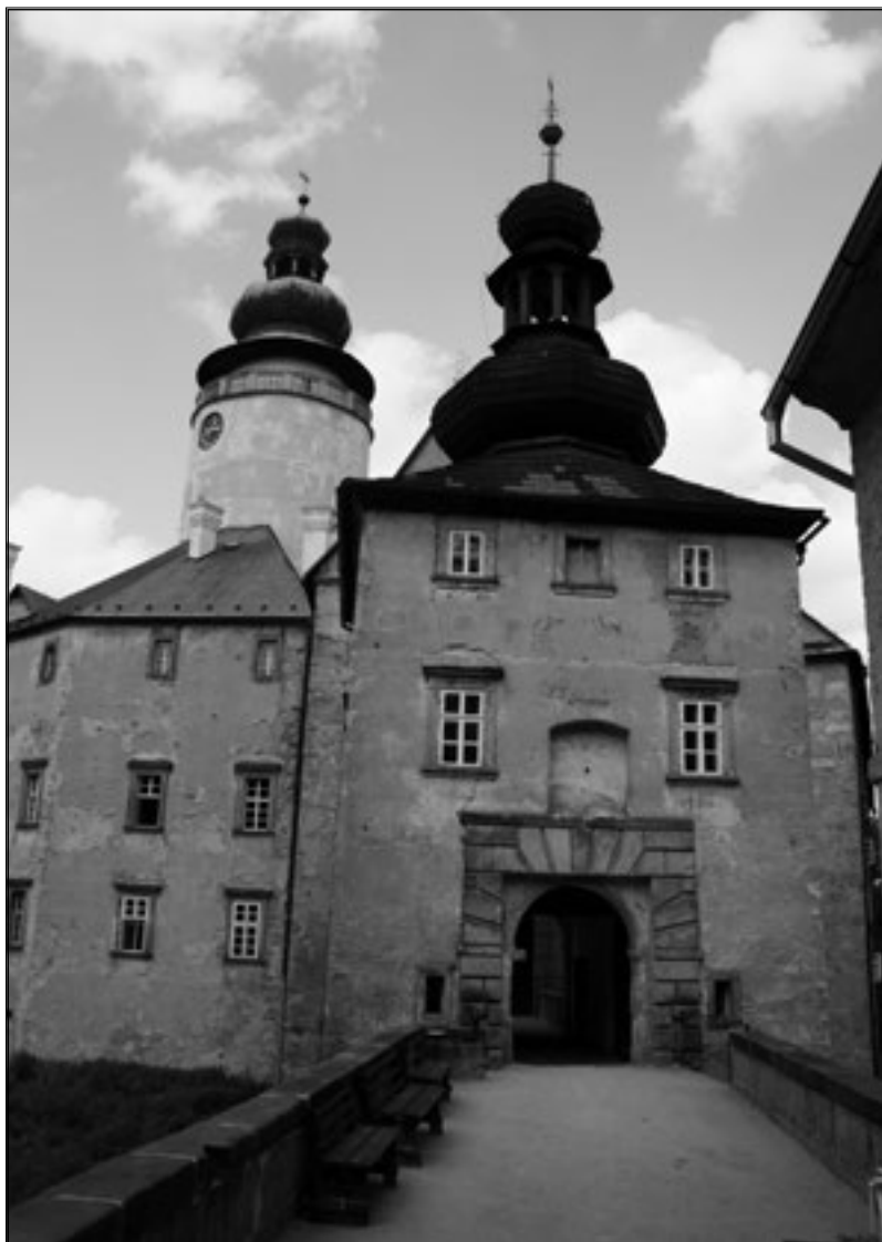
Koncem druhé světové války byly na hradě Lemberce uskladněny nacistické archiválie.