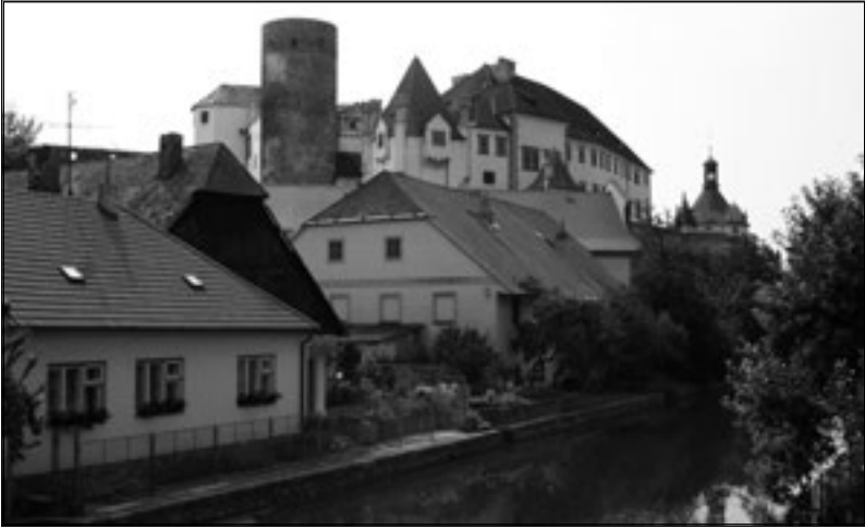
Klid pánů z Růže střežila v Jindřichově Hradci odedávna Bílá paní.

Bývá vidět, jak vážným krokem obchází hrad se svazkem klíčů za pasem, jak otvírá či zavírá tu či onu komnatu. Kdo ji náhodou potká a pozdraví, tomu odpoví, na znamení úcty pokyne hlavou a pokračuje dál.