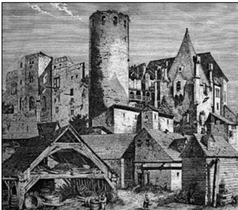
Nejstarší část jindřichohradeckého zámku.