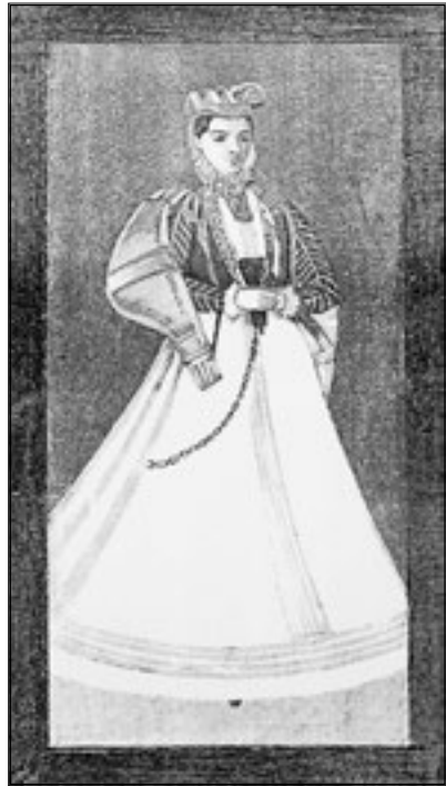
Údajný obraz Bílé paní na jindřichohradeckém zámku.

Na jindřichohradeckém zámku se můžete setkat s ledasčím zajímavým. Do alchymistických souvislostí bývá někdy dávána