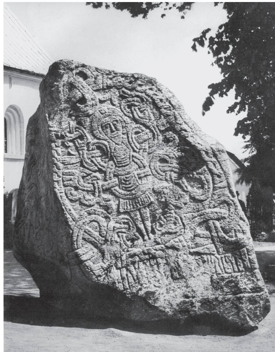
12. SVĚDEK CHRISTIANIZACE: KÁMEN Z JELLINGU

Dělení majetku, rivalita mezi Chlodovechovými potomky zdržují rozmach Franků, který se na počátku 8. století zdá ohrožen i úpadkem merovejské dynastie – obraz zahálčivých králů se stal legendou – a franckého duchovenstva. Frankové nejsou tehdy už jediní pravověrní vyznavači západního křesťanství. Visigóti a Langobardi zanechali ariánství a přestoupili ke katolictví; papež Řehoř Veliký (590–604) přistoupil k obrácení Anglosasů na víru a svěřil je mnichu Augustinovi a jeho druhům; první polovina 8. století je svědkem toho, jak katolicismus díky Willibrordovi a Bonifácovi proniká do Fríska a do Germánie.