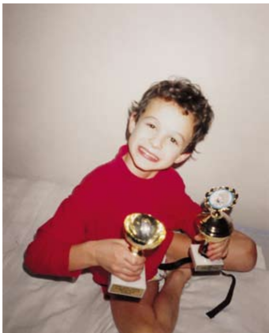
■ Já se svými prvními poháry

Snad první výraznější zlom přišel v létě, kdy mi bylo šest let. Už i předtím jsme chodili na umělou stěnu, která byla tehdy v Brně, v hale na Rosničce. Tenkrát tam ještě nebyly cesty po barvičkách, ale stěna měla deset linií a v jedné linii byly jen šedé úchyty a jen jedna cesta nahoru. Vzpomínám si, jak dlouho se mi nedařilo vylézt ani tu nejjednější trasu. Pokaždé jsem vylezl o pár metrů a pak zpravidla přišel nějaký příliš dlouhý krok, na který jsem jednoduše nedosáhl. Tím to pro mě končilo. Asi v šesti letech už jsem vyrostl dost na to, abych tuhle cestu vylézt dokázal, a nesmírně mě to motivovalo. Hned vedle byla cesta ještě o něco náročnější, takže jsem se o ni pokoušel snad pokaždé, když jsme tam s maminkou zašli.