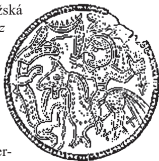
Brakteát (amulet) z norského Gundsvalenu, Ódin bojuje s vlkem Fenrim, zlato, průměr 2,75 cm.

Síla run jako amuletu se umocňovala použitím celé runové řady. Kompletní runová řada na náhrobním kameni z Kylveru měla buď chránit hrob před poškozením, nebo zabránit návratu mrtvého. Jako silové a ochranné symboly nacházíme runy na četných předmětech každodenního života, na sponách, brakteátech, hřebenech, zbraních a špercích.