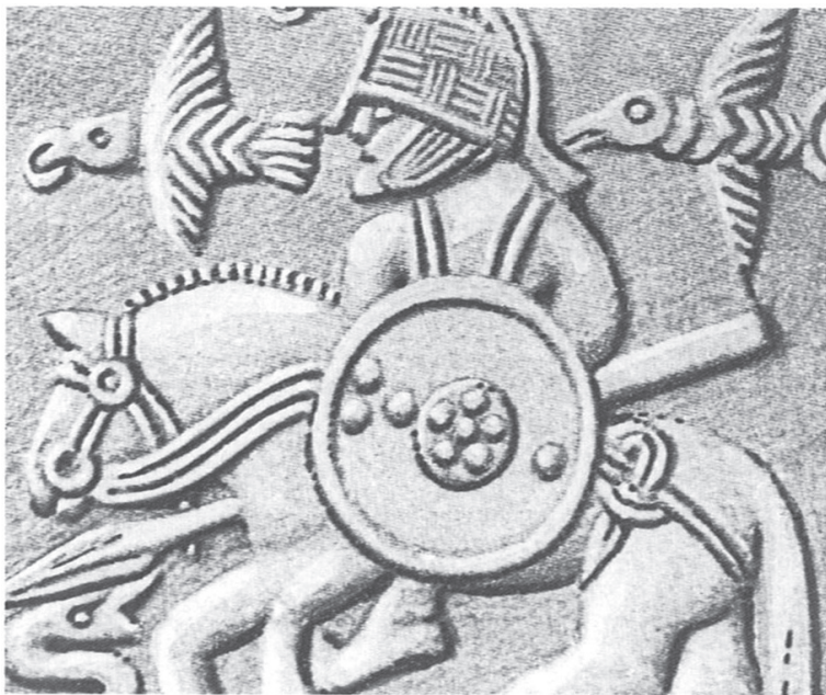
Wodan (Ódin) na koni Sleipnim s havrany Huginem a Munirem; reliéf z tzv. vendelské přilby, Švédsko, 7.–8. století (Statens historiska museum, Stockholm).

Tacitus uvádí jako hlavní bohy Germánů Mercuria, Marta a Hercula, dále zmiňuje bohyně Isidu a Nerthus, přičemž Nerthus je tu jediné germánské jméno. Tři jména bohů přirozeně vyvolávají asociaci s jinými božskými triádami, a to ani ne tolik s triádou z římského Kapitolu – Jupiterem, jeho manželkou Junonou a dcerou Minervou – jako spíše s keltskou triádou Taranis, Teutates