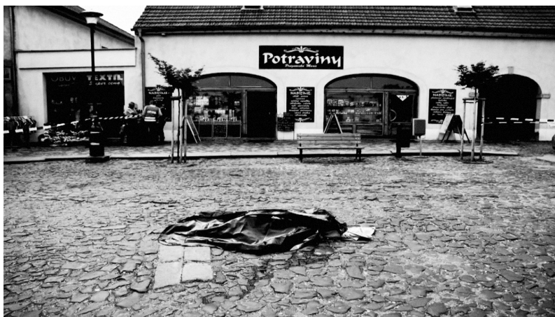
Oblíbený řemeslník se snažil krádeži zabránit.

ho, kdyby toto vozidlo někde viděl, aby to vozidlo získal zpět, protože je jeho a bylo mu odcizeno.“