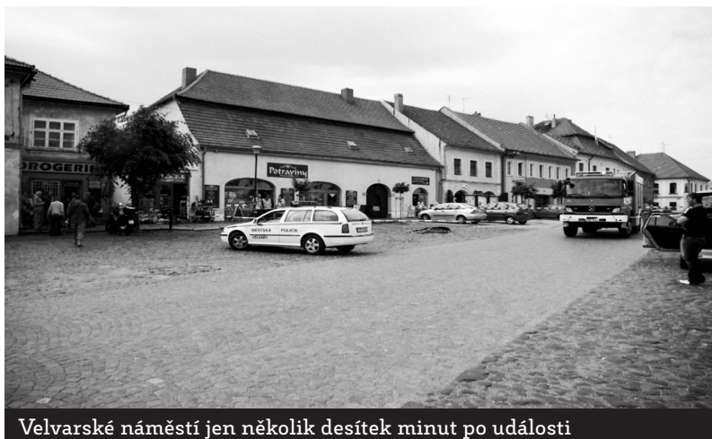
Velvarské náměstí jen několik desítek minut po události