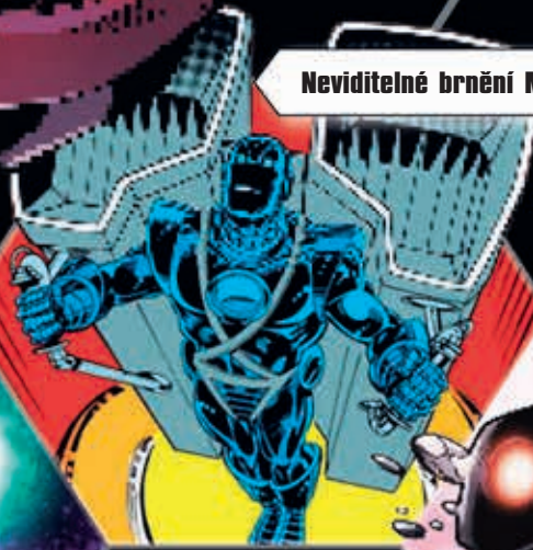
Neviditelné brnění MK II