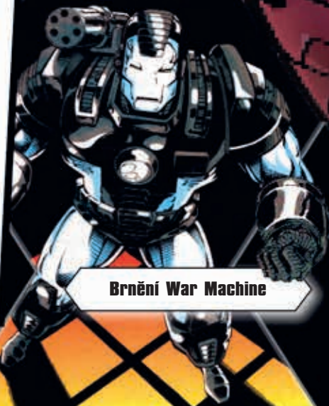
Brnění War Machine

...a to není vše! Tolik má Iron Man různých obleků.