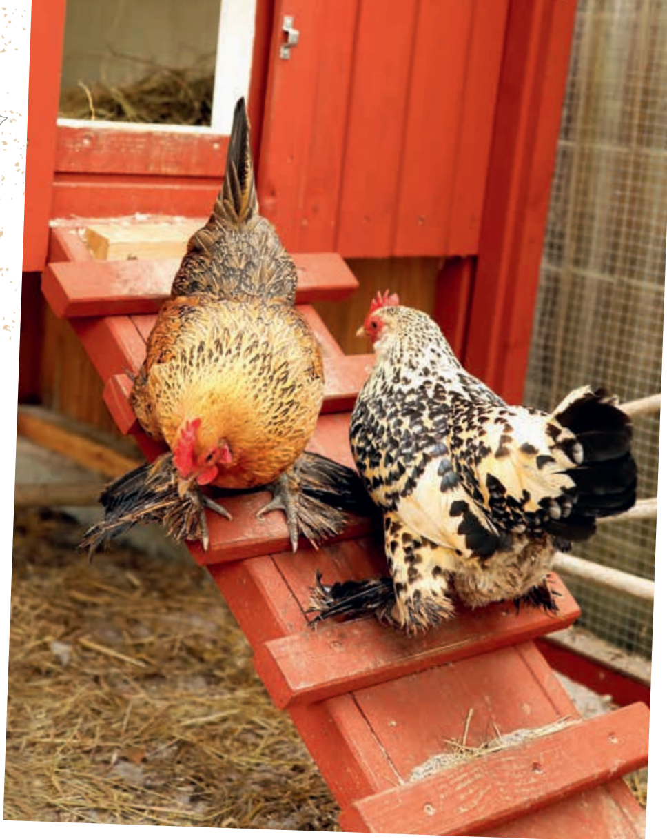
Luna nahoru, Koko dolů, tlačence na žebříku