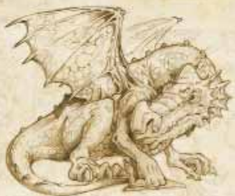
Dráče zlatého ohnivého draka.