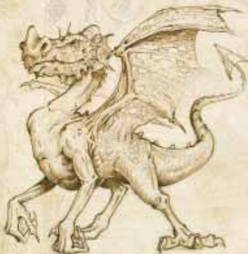
Mladý zlatý ohnivý drak.