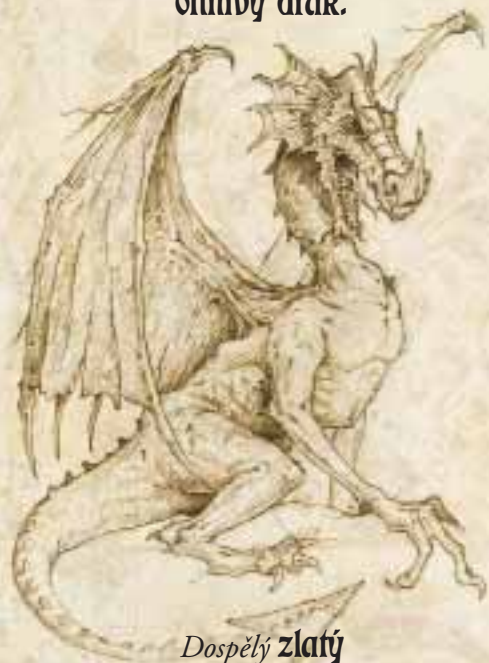
Dospělý zlatý ohnivý drak.

N ěkteří tvrdí, že většina dráčat stráví před vylíhnutím ve svých vajíčkách tři tisíce let – tisíc let v hlubinách oceánu, tisíc na ledových vrcholcích hor a tisíc pod hřejivým sluncem.